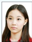
頭部側向 一邊、未 正視鏡頭