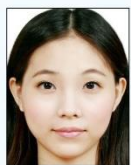
頭部比例 過大或頭 髮碰觸到 照片邊框