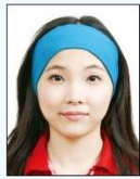
臉部及雙 耳被物品 遮蔽