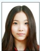
頭髮遮蔽 到眼睛或 耳朵