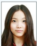
頭髮遮蔽 到眼睛或 耳朵