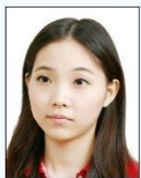
頭部側向 一邊、未 正視鏡頭