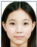
頭部比例 過大或頭 髮碰觸到 照片邊框